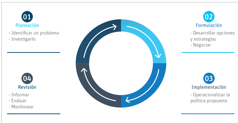
Figura 1. Ciclos en la formulación de políticas

Considerando el ciclo de formulación de políticas que se presenta en la figura 1, se proponen tres opciones de contenido diferentes. La primera opción permite fundamentar y documentar un hallazgo relevante (planeación); la segunda busca analizar propuestas de intervención (formulación), y la tercera busca sugerir un curso de acción particular (implementación), con lo que de hecho puede incluir un tema en la agenda política y apoyar su resolución. Las cuentas en sí mismas participan en el proceso de monitoreo. El objetivo de esta publicación es guiar a los economistas de la salud, los analistas de política y de sistemas de salud, los académicos e investigadores y los usuarios de las cuentas en la preparación de resúmenes de política que incluyan el tipo de contenido de estas tres opciones, según corresponda. También apoya principalmente a los economistas de la salud, quienes pueden generar un resumen directamente asociado a los resultados de las cuentas de salud o contribuir a documentar resúmenes de política que preparan otros actores.